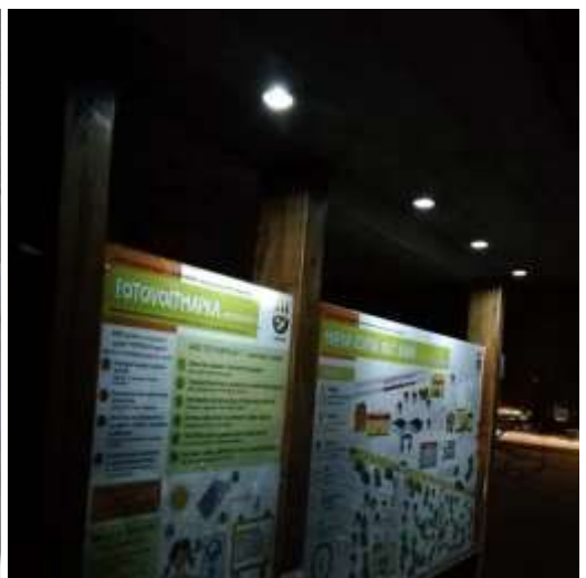
Svetlá sa cez deň rozsvetujú tlačidlom, v noci sa aktivujú fotobunkou automaticky.